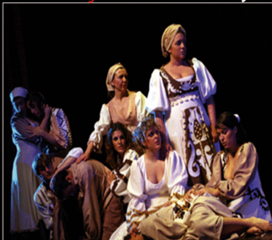
Tragedia histórica 90 minutos